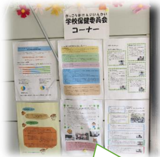
第1回学校保健委員会の 内容や取り組みなど