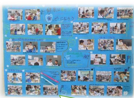
歯科検診や歯みがきの様子