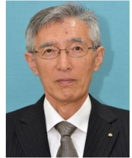
南相馬市 教育委員会教育長

2月に福岡県で、1年生児童が給食で出されたウズラの卵をのどに詰まらせて亡くなるという痛ましい事故がありました。文部科学省から「窒息が起こりやすいのは、きゅう歯がなく食べ物をすりつぶすことができない、食べる時に遊んだりするなどのため」と原因に関する通知がありました。私は、給食の時間が短いために子どもたちは急いで食べなければと思っていることの方が問題だと思っています。日課表の見直しや準備・片付けの工夫など、子どもたちがゆっくり噛んで食べることができる時間を確保することを考えたいと思います。ご家庭でもゆっくり味わって食事をするようにご協力よろしくお願いします。