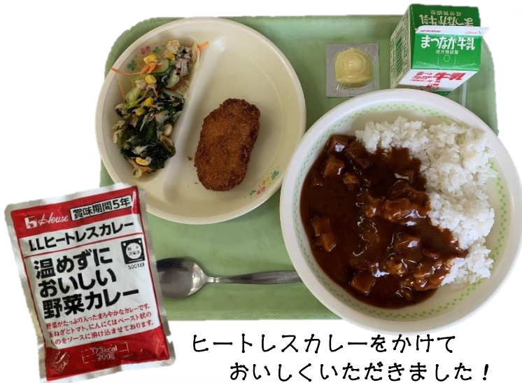
ヒートレスカレーをかけて おいしくいただきました！

“ヒートレスカレー”とは、温めずに食べることができる非常食ですが、今回は、できるだけ温かい給食になるよう、カレーは温めたものを食べました。この機会に、いつ、どこで起こるか分からない災害に備え、各ご家庭でも非常食を含む防災バッグを準備したり、家族と避難場所を確認したりするなどしておきましょう。