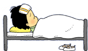
具合がわるいとき