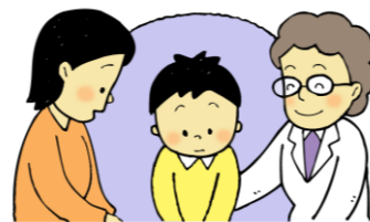
こまったことがあるとき 話を聞いてほしいとき