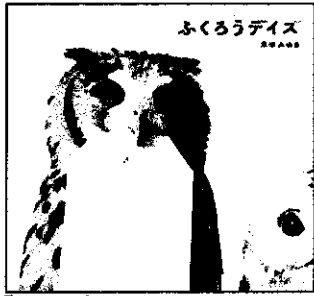
『ふくろうデイズ』 913/70 「ふくろうデイズが大好き」 「ふくろうデイズが大好き」

10月中旬に、3年生の図書委員が図書室にある本の中からエントリー作品を選びました。 「良い！」と思った表紙の本に投票してもらって大賞を決定！