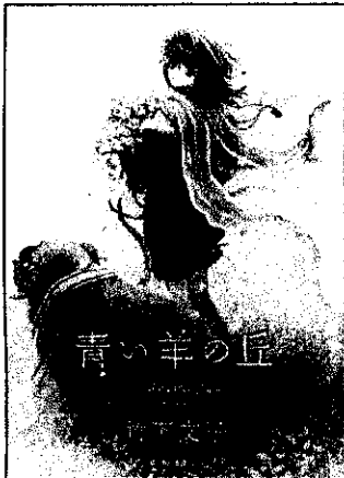
『青い羊の丘』 913/44 「細かいイラストが可愛い」と思いました。ニャーの大好きです。 「絵がきれいだから」