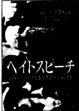
『ヘイトスピーチ』 913/77 「つよつよだから」 「面白、にこむ」

栄えある大賞は 『ハイキュー！！ ショーセツパン！！1巻』 でした！ 星希代子著 913/ホシ