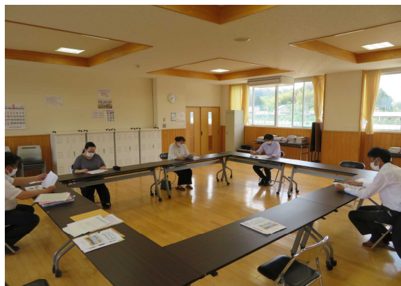
学校評議員会の様子