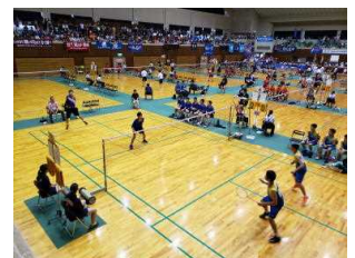
バドミントン男子

7月22日（月）から24日（水）の3日間にわたって行われた県中学校体育大会に、バドミントン男女の団体と個人、ソフトテニス女子団体、柔道男子団体と個人、柔道女子個人が出場しました。どの部も県大会のレベルは高く、勝ち進むことはできませんでしたが、自分達の持てる力を出し切ることができました。