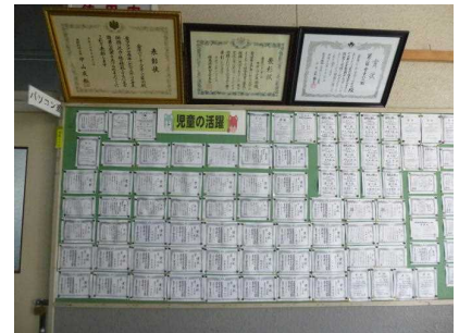
子ども達の獲得した賞状