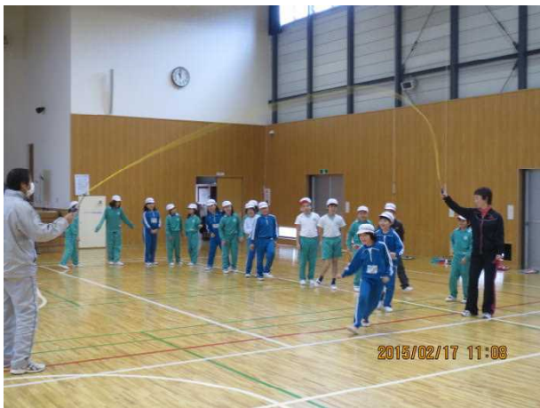
【中学年 なわとび記録会大縄とび】

低・中・高学年ブロックに別れて「なわとび記録会」を開催しました。今年は、昨年11月に完成したばかりの体育館で行うことができました。冬休みに入る前から自分のめあてを決めて、学校でも家庭でも一生懸命練習したお子さんもいたようです。当日は、練習の時よりもタイムや回数が伸びなかったお子さんもおり、中には、涙を流して悔しがる姿も見られました。今まで一生懸命練習してきたからこそその意味のある涙だったのではないかと思います。教師や友だちから温かい励ましの言葉をかけられている姿は、とても微笑ましく心温まる場面でした。記録会が終わってからの体育の時間に合格した児童もたくさんいます。合格証、記録証を後日お渡しします。ご家族の皆様には、お忙しい中応援に来ていただきありがとうございました。