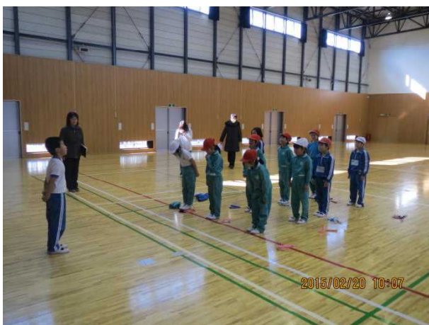
【低学年なわとび記録会閉会式】