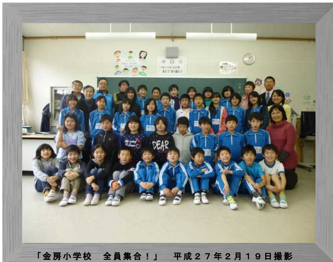
「金房小学校 全員集合！」 平成27年2月19日撮影