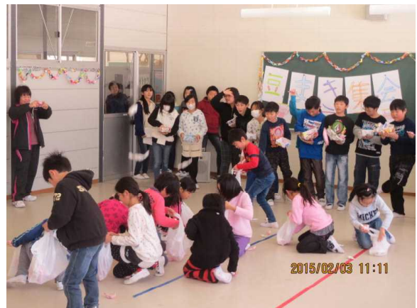
【5年生が元気よく豆まき】