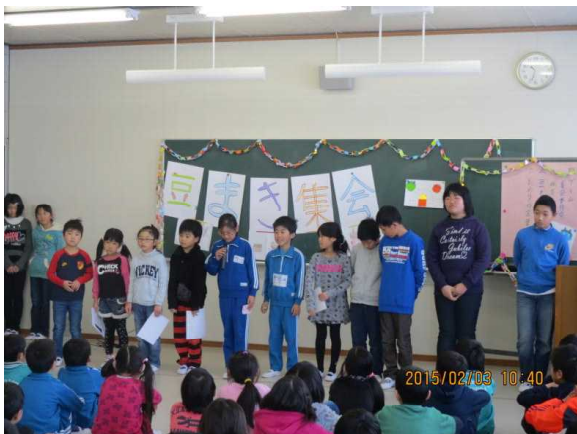
【各学年代表の「追い出したい鬼」の発表】

○なまけ鬼 ○寝坊鬼 ○ゲーム鬼 ○おしゃべり鬼 ○夜ふかし鬼 ○宿題忘れ鬼 ○泣き虫鬼 など