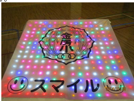
【金房小からのメッセージ】

11月30日（日）に、小高区観光協会・南相馬市文化スポーツ課主催のイルミネーション点灯式が完成したばかりの体育館と仮設校舎南側校庭で行われました。あいにくの小雨模様で点灯式のみ外で行いましたが、できたばかりの体育館を子どもたちや保護者の方にみていただくよい機会でもありました。