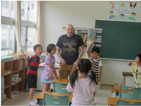
【第2学年「英語活動」1～10までの数】