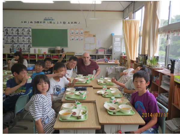
【仲良く給食（第5学年）】