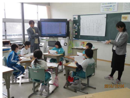
第3学年 【グループでの意見交換】