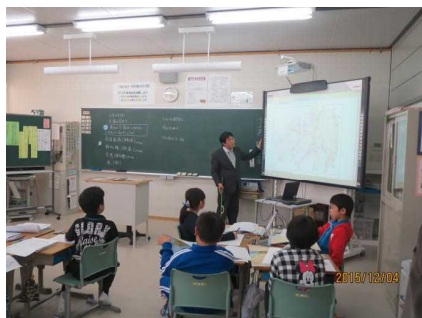
第4学年 【福島県内の高速道路は？】