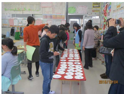
第5学年 【紙上バイキング！】