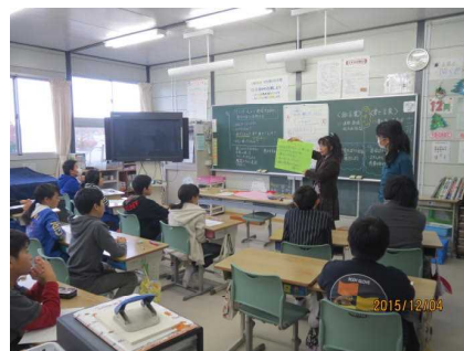
第6学年 【情報モラルの学習】