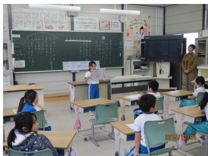
第1学年第 【お手伝いについて発表】