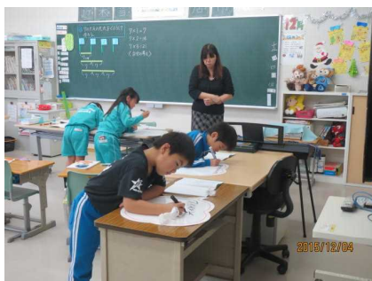
第2学年 【自分の考えをホワイトボードに記入】