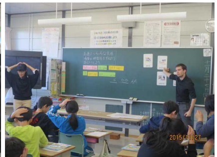
第6学年 外国語活動