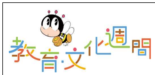
【文部科学省「教育文化週間」ロゴ】

また、お話等ありましたら、担任はもとより、お気軽に校長、教頭、教務、養護教諭、事務に声をかけていただければと思います。お待ちしております。