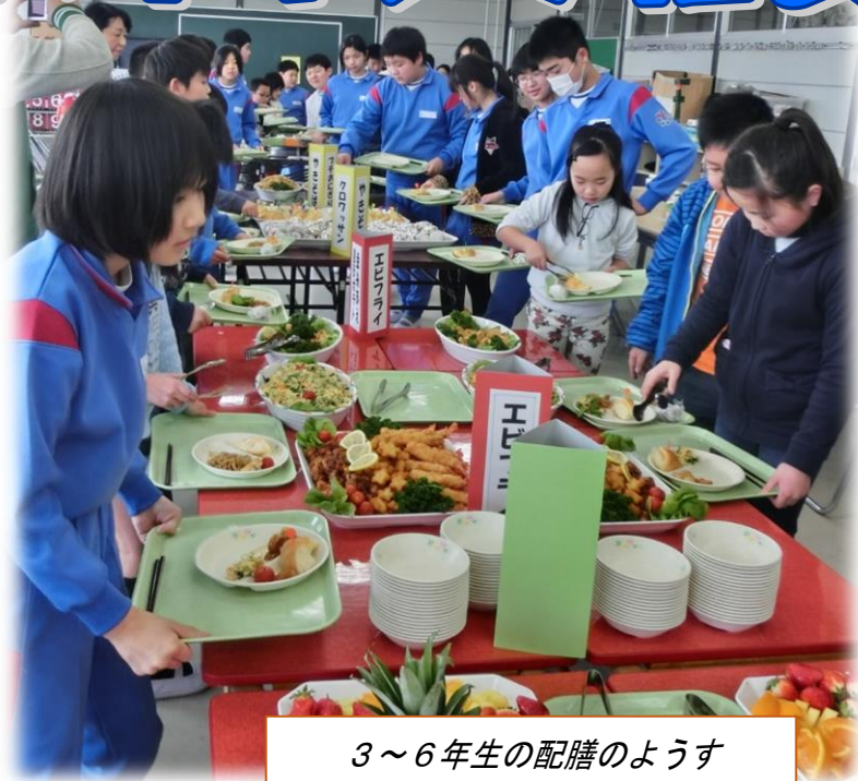
3～6年生の配膳のようす

3月8日(火)に、バイキング給食を実施しました。「バイキング」とは、今から1000年前にヨーロッパ各地の海岸をあらし、スカンジナビアに住んでいた海賊のことを言います。この海賊が丸ごと焼いた肉や、いろいろな料理をたくさん並べていたことから、現在、きれいに盛りつけた料理から一人一人好きな料理を選んで食べる方法を日本では「バイキング」と呼ぶようになりました。