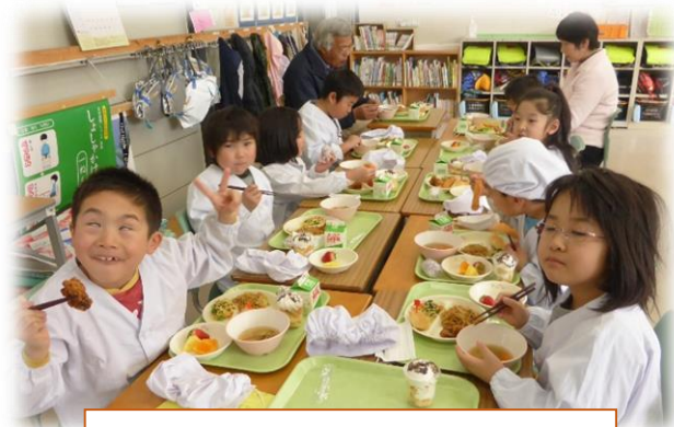
バイキングを楽しむ低学年

メニューは、フルーツ盛り合わせを含め、12品目。会場の関係で、3～6年生は多目的室で、1・2年生は、1年教室を使って行いました。子どもたちはお腹と相談しながら、好きな物を選びつつ、楽しく会食していました。