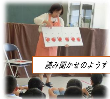
読み聞かせのようす

絵本では、「だるまさんが」の後、私たちの期待を裏切った意外な「言葉」で、楽しませてくれます。「だるまさんが」のかけ声をみんなで一緒に唱えながら読むと、また格別です。よかったらお子さんと一緒に、読んでみてはいかがでしょうか。