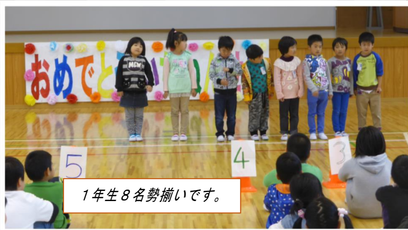
1年生8名勢揃いです。