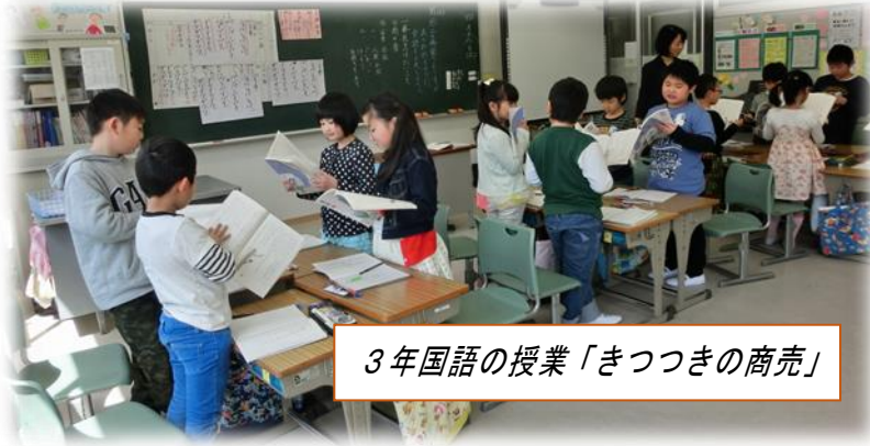
3年国語の授業「きつつきの商売」

18日(土)の授業参観はいかがだったでしょうか。学年も1つ上がり、学習も少し難しくなりましたが、子どもたちは積極的に学習に取り組んでいたように感じます。緊張のため発言が少ない学級も見受けられました。どんなふうに問題をとらえ、答えたらよいか戸惑いもあったのでは