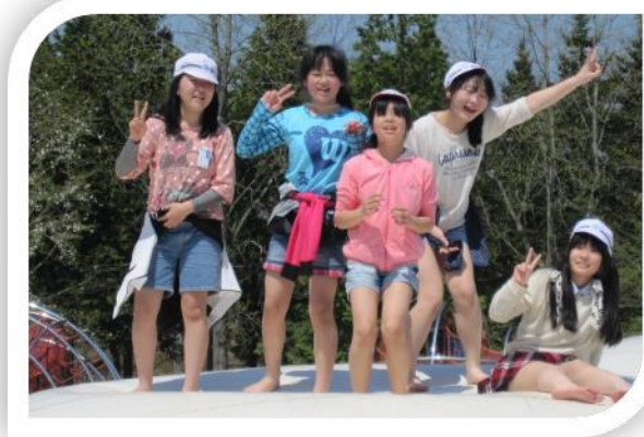
【高学年】 みちのく杜の湖畔公園