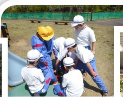
【低学年】 わくわくランド