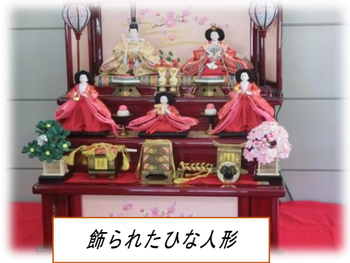
飾られたひな人形

3月3日のひなまつりまで、飾っていますので、学校においでの際はぜひご覧ください。