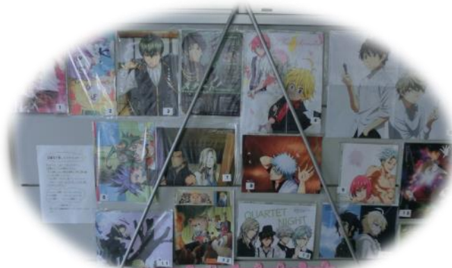
景品は、図書室の壁に掲示しています