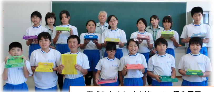
完成したトレイを持って、記念写真

て磨き、最後に色を塗って仕上げます。森林のはたらきについては、国語科をはじめとして様々な教科で学習していますが、今回のように、木にふれ、親しむ体験も大切だと感じました。