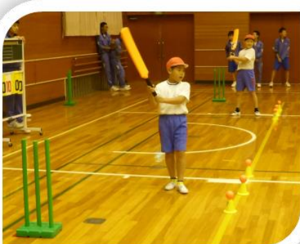
バッティングの練習のようす

あくまで「避難指示区域の解除」が前提になりますが、本校でも、皆様の疑問やご心配にできるだけ答えてまいりたいと思いますので、遠慮なくご相談ください。