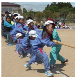
三年 茂木 大芽 ぼくは、八 十メートル 走で五位で した。一生 けん命走 りました。次 のしゅ目の チャンスを 引いて、二 位をとって 、とてもうれ しかったです。 一年生から 三年生まで のリレーは 、ぬかさ れなくて、 よかったです。