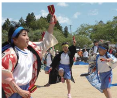
二年 うめ田 れお ぼくは、よ さこいをお どりました。 さいごの「ど っこいしょ」 のところが かっこよく きめること ができました。 とてもうれ しかったです。