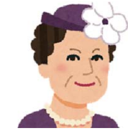
(大人になったヘレンさんです。)

一年 むらかみ おうすけ みんなで、にんぎょうげきを をみました。ずっこけ3にん ぐみのおはなしでした。 まほうのかがみで、むかし にいったのがおもしろかった です。3にんは、なかよしだ とおもいました。 また、みたいです。