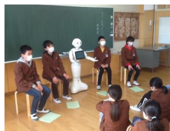
人型ロボットを使ってプログラミングの発表をする6年生

先週行われた授業参観には、師走のお忙しい時季にも関わらず、多くのみなさんにおいて頂きありがとうございました。臨時休校の2ヶ月間を取り戻すかのように、子ども達は学習に行事に一生懸命取り組んできました。その成長の様子をご覧いただけたなら嬉しいです。また、各学年懇談会では、お子さんの成長に合わせた成果や課題について話し合われたと思います。冬休みまであと少しです。学習のまとめにしっかりと取り組むためにも、「十分な睡眠とバランスの良い食事」を心がけた体調管理へのご協力をお願いいたします。