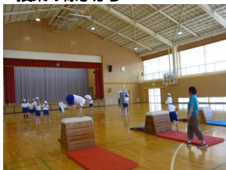
4年生は、音楽に合わせてリズムカルに跳び箱を跳んでいました