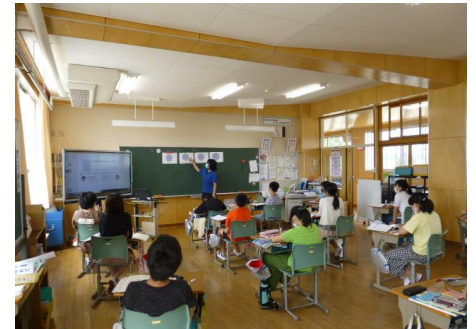
Sixth graders are learning to find target lines for shapes (it's getting harder!) (It's important to review.)