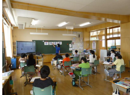
6年生は、図形の対象線を見つける学習(難しくなってきますね! 復習が大事です)