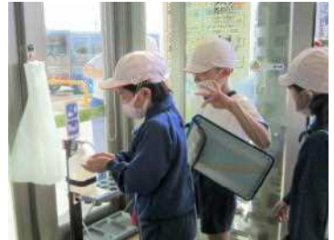
<店に入る前に手指を消毒>

いつも買い物をしているスーパーマーケットには、いろいろな仕事があり、多くの人が働いていることを学習することができました。フレスコキクチの皆さん、ありがとうございました。