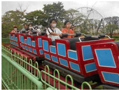
八木山サイクロン

今年度は、校外での学習や家族で出かけることもなかなかできない状況ですが、久しぶりに屋外で動き回り、ベニーランドで楽しく活動することができました。