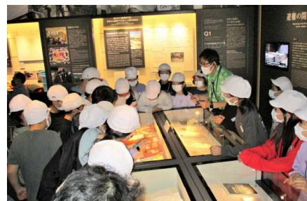
【東日本大震災・原子力災害伝承館】