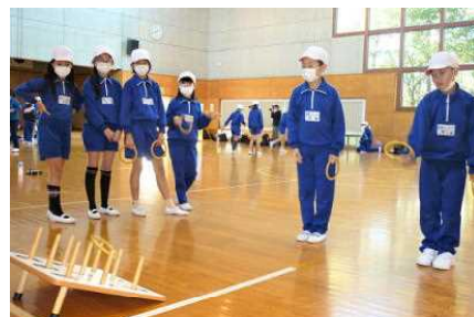
【ニュースポーツ(輪投げ)】