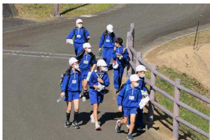
【海浜オリエンテーリング】