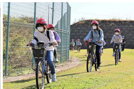
【マウンテンバイク】