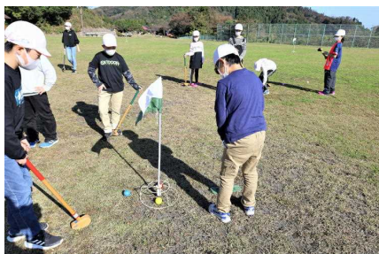
【グラウンドゴルフ】