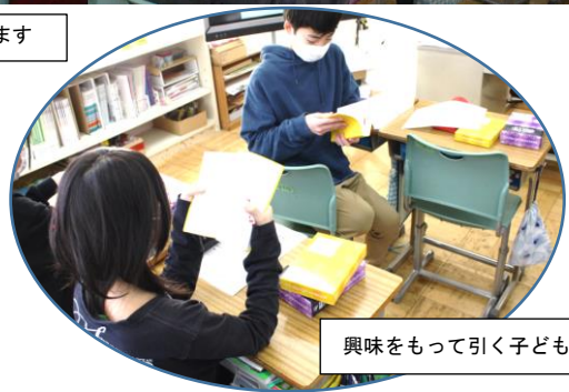
興味をもって引く子ども