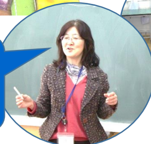
シェリー先生も見に来ていただきました