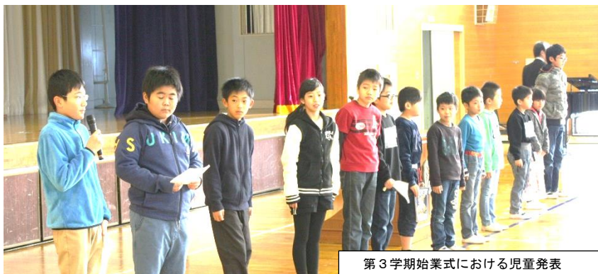
第3学期始業式における児童発表