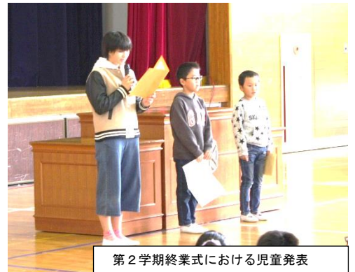
第2学期終業式における児童発表