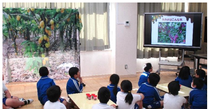
4年生のカカオ教室では、カカオの実を見ることができました。チョコレートの秘密を学びました。

また、11月28日は、1年生が「レモンラッシー」を作り、5年生が「進んで運動しっかり食べよう!」をテーマに学びバターを作りました。さらに、11月29日のカカオ教室では4年生が、チョコレートの食べ比べをしました。