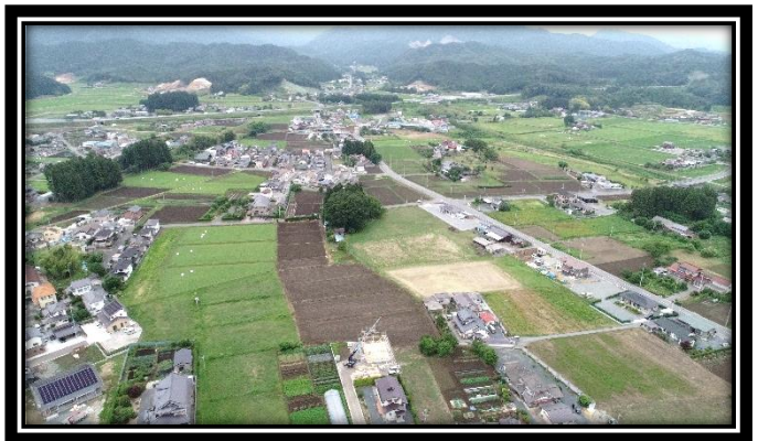
ドローンによる空撮映像：北東方面