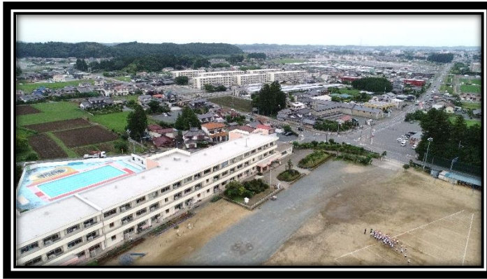
ドローンによる空撮映像：西方面