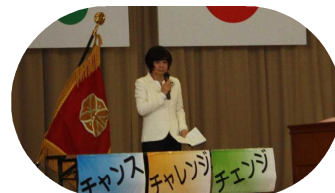
始業式での校長式辞

第1学期始業式 校長より、「本気・元気・やる気」の他に、今年度のスローガンである「夢に向かって、チャンス・チャレンジ・チェンジ」できるように頑張ってもらいたいと話しました。