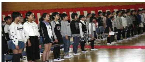
入学式で校歌を披露する6年生