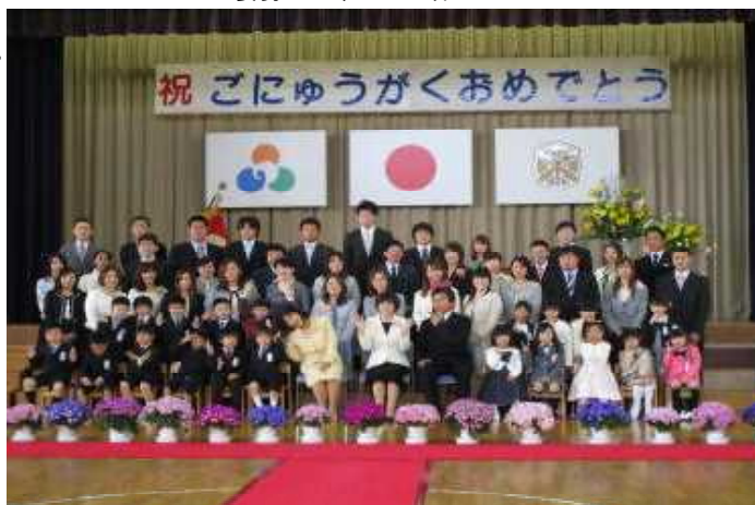
最後の記念写真は、好きなポーズで！

全教職員で子どもたちの健全な育成を目指して指導いたします。《裏面もご覧ください》