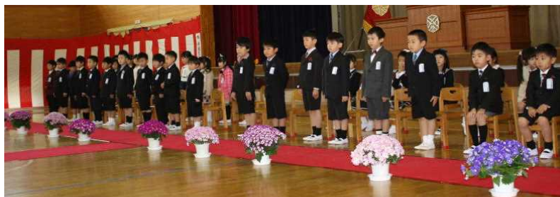
いい姿勢の1年生40名！