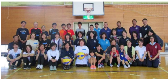
大会終了後、本校のメンバーで記念写真！ ハイッ、チーズ！