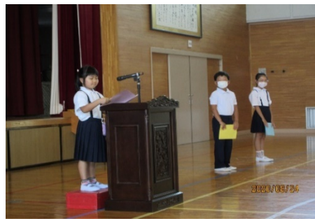
夏休みの思い出と2学期のめあて発表