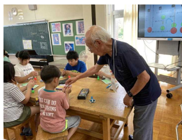
【おもしろ理科教室】