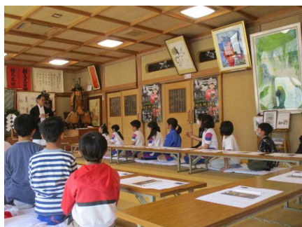
【3・5年：太田神社見学】