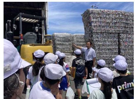
【5年生 総合的な学習の時間「地域の文化・産業について調べよう」】