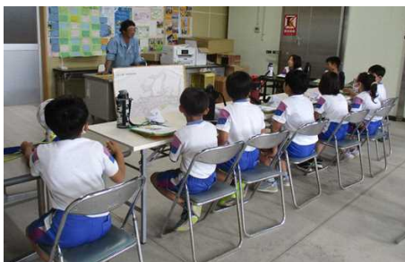
【3年生 社会科「農家の仕事」】

人との関わりや本物にふれる感動は、実際に出かけて、見て、聞いて、触れてみないと味わうことができません。まさに、「百聞は一見にしかず」。保護者の皆様には、準備等でお世話になりました。これからも、校外学習を通して、子どもたちの学びを深めてまいります。