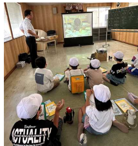
【4年生 社会科「ごみの処理と利用」】