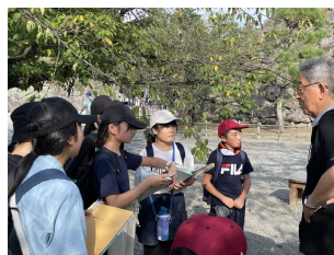
【観光客にインタビュー】