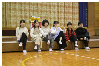
6年生 『STAND BY ME AKAONI』