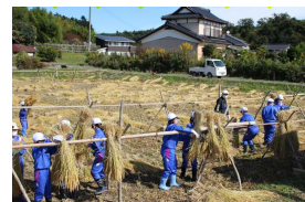
【『はせがけ』にも挑戦!】