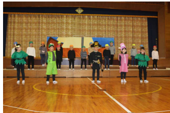
1・2年生 『ピーターパン』のいる島

太田小学校の全校生、そして、教職員全員の総力を挙げて取り組んだ学習発表会。人数制限をしておこなった開催とはなりませんが、子どもたち、教職員の『本気』の姿をご覧いただけたいと思います。ことばにできない感動の発表会になりました。