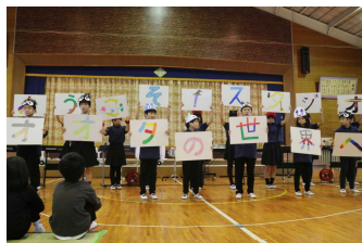
4・5年生 『ようこそ!スタジオオタ』の世界へ