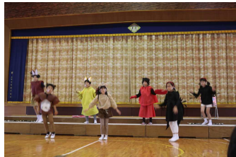
3年生 『ツバメの商売』