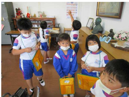
【質問も熱心に・・・】