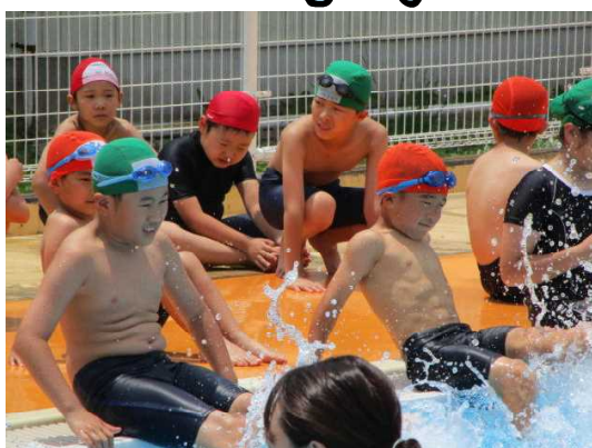
【5年生も大活躍!2年生も安心!】