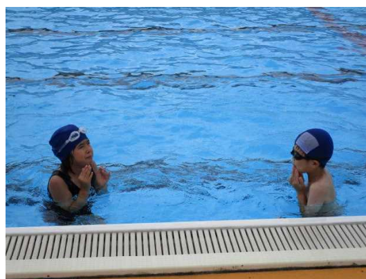
【約束を守って楽しい水泳学習に!】

7月には宿泊活動を行います。今年度は、5・6年生で、いわき海浜自然の家に行ってみます。みんなで協力し、実り多い宿泊活動にしたいと考えています。