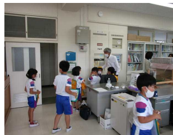
【職員室には・・・】