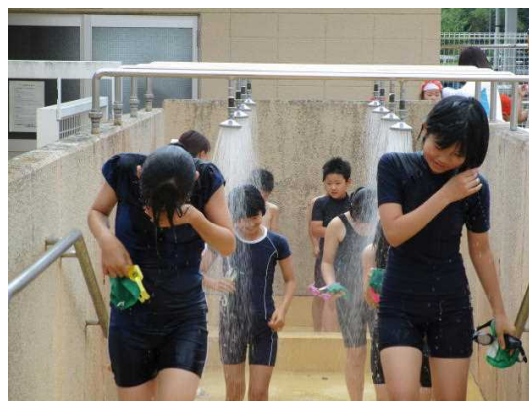
【今年初めてのシャワー!】