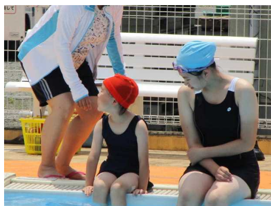
【初めてのプールは6年生と一緒に!】