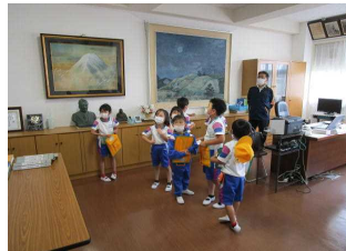
【校長室には・・・】

去年は教えてもらう側だった2年生。今年は立場が変わり、ちょっとだけ大人になった瞬間でした。さて、1年生のみんな。学校には何があるのかな？来年は、説明できるかな？