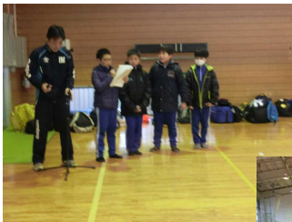
「体育館での出発式」 司会の人たちも少し緊張気味です。

初日は計画通り自然の家の広場でスキーの初歩を行うことができました。でも2日目は、雨のため、なんと、スキー場がクローズされてしまいました。急遽計画を変更して、白石城の見学などを行い、子ども達の思い出に残る活動を実施することができました。3日目は良い天気の中、スキー場での活動を行うことができ、リフトで上まで行き、全員下まで滑りきることができました。活動の様子を紹介します。