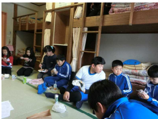
「昼食」 13名の5年生は、とてもまとまりがいいです。お弁当をおいしくいただきました。