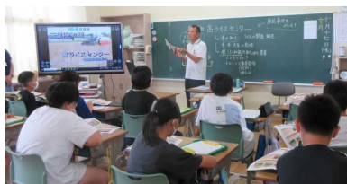
有限会社高ライスセンター様