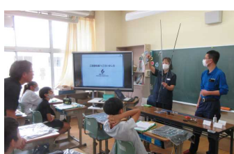
藤倉コンポジット株式会社様