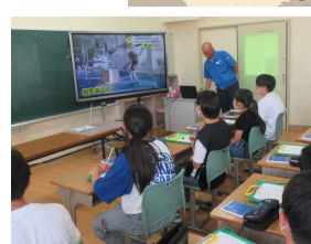
株式会社タカワ精密様