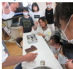
株式会社松月堂様