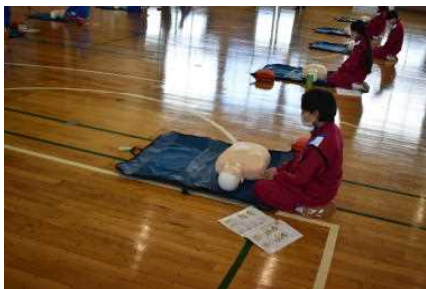
普通救命講習会（2学年）