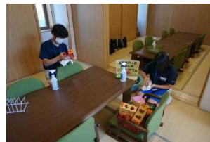
小高交流センター

今年度の職場体験学習は、小高区内5カ所で事業所等のご協力をいただき実施しました。はじめは緊張していた生徒たちも、体験先の方々のご配慮により、次第に笑顔が見られるようになりました。この体験を通して、働くことの意義や尊さ、大変さを実感するとともに、将来の職業選択における貴重な経験になったと思います。また、普段の生活における清掃などの勤労・奉仕的活動に対する取り組みを見直す機会にもなったことと思います。