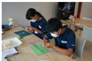
小高ワーカーズベース