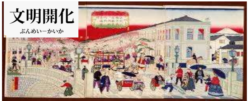
三代歌川広重《東京開化名勝京橋石造銀座通り両側煉化石商家盛栄之図》1874（明治7）年

文明 ぶんめい 開化 かい の象 しょう 徴 ちよう となった肉食 にくしよく 「牛鍋 ぎゅうなべ 」「すき焼き や 」