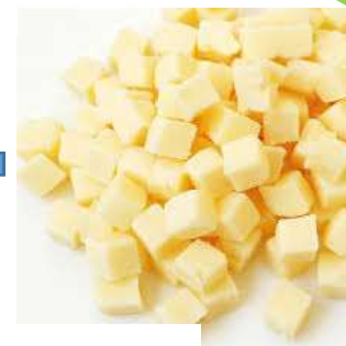
レーズンチーズ蒸しパン