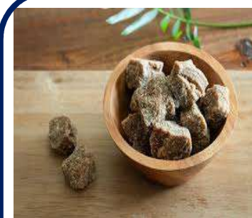
こくとう む 黒糖蒸しパン