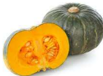
かぼちゃ蒸しパン