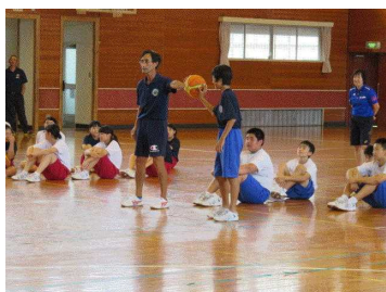
（小田・西先生による保健体育の授業）