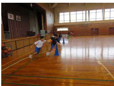
（生き生きした生徒の様子）

それぞれの授業で、生徒たちの生き生きとした姿を見ることができました。生徒たちが一つの課題に対して、多くの視点から様々な捉え方をし、しっかり表現できていることはすばらしいことです。その後の先生方の分科会では真剣な討議が進められていました。本校の先生方の授業が「とても参考になった」と言われておりました。