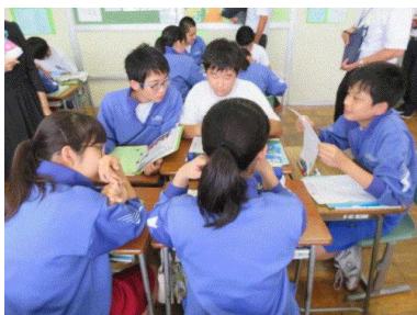
（グループでの話し合い）