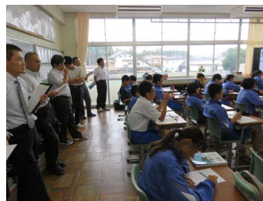
（広野から新地までの24名の先生による授業参観）