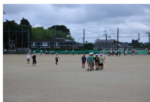
【校庭で遊ぶ児童たち】

なつて作業する姿が見られ、大変嬉しく思いました。また保護者の皆様の除草作業も、そして環境委員の皆様の一輪車で雑草の回収作業も、ほとんど休みなく行っていたくださり、心から感謝申し上げます。