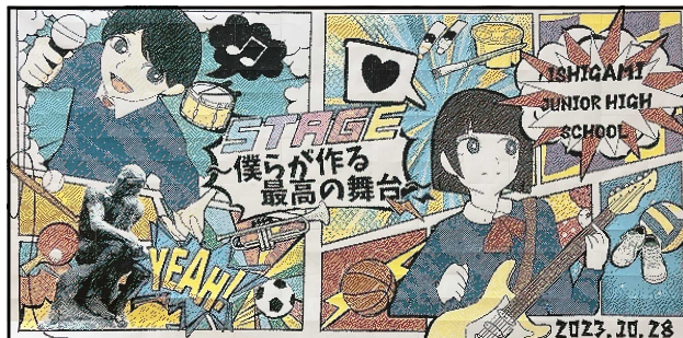
全校生で作ったビッグアート