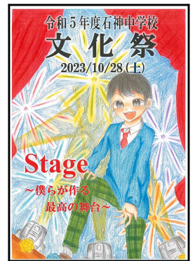
文化祭のポスター