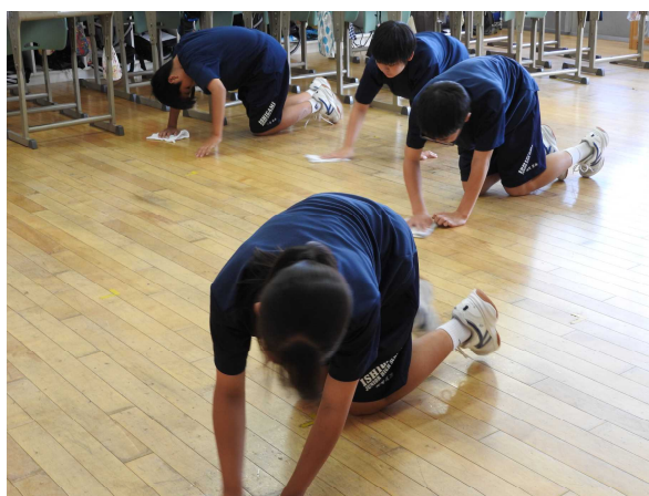
膝をつけて床を磨く生徒たち