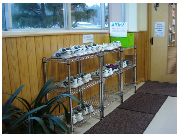
図書室入り口に並ぶ靴

4月から「品格のある石神中」を目指し、ことあるごとに生徒と教職員に話を続けてきました。品格とは、「その人やその物に感じられる気高さや上品さ、品位。「品格が備わる」ことを言います。言葉や動作など目に見える“品”もありますが、心や性格などはどうでしょうか。「性格の美しい人は残り姿に表れる」という話を第1号の学校だよりで紹介しました。残り姿の美しさの一つとして「脱いだ靴を揃える行為」です。本校図書室を使う生徒の皆さん、いつもきれいに靴が揃えてあり、皆さんの「残り姿の美しさ」が伝わってきています。皆さんの「立ち振る舞い」が美しいのです。乱雑に履き散らかされている靴よりも、整然と揃えられた靴の方がはるかに美しいことは一目瞭然です。そして見た目だけではなく、そこにはそれを見た人、そこを使おうとしている人に対する物言わぬメッセージも込められています。見る人を不快にさせない、次の人が使いやすくするという心遣いと言ってもいいでしょう。靴を揃えるという立ち振る舞いや膝を床につけてぞうきんがけをする行為など、皆さん自身の美しさ、品格がそこに表れているのです。とても素晴らしいと感じました。