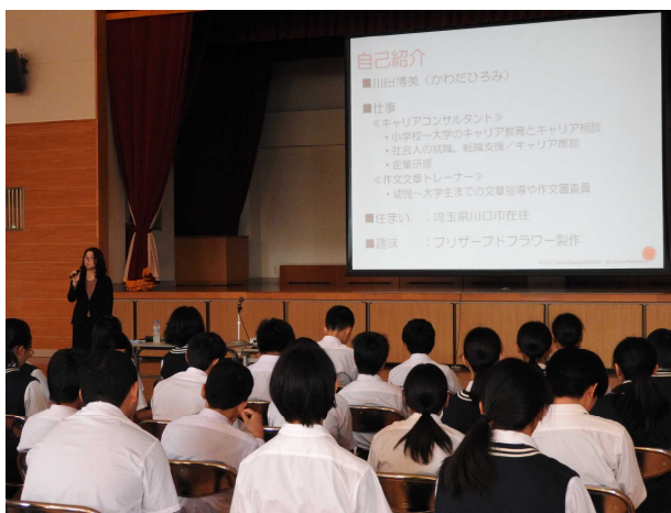
真剣に講話を聞く2年生